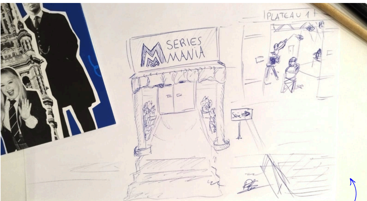
Ambiance Séries Mania par Félix

Alors, les séries, ça rapproche ou ça éloigne ? Finalement, Félix, Béatrice et Chloé sont venus ensemble à Séries Mania ; comme quoi, pas besoin d'avoir vu les mêmes choses pour aller au même endroit.