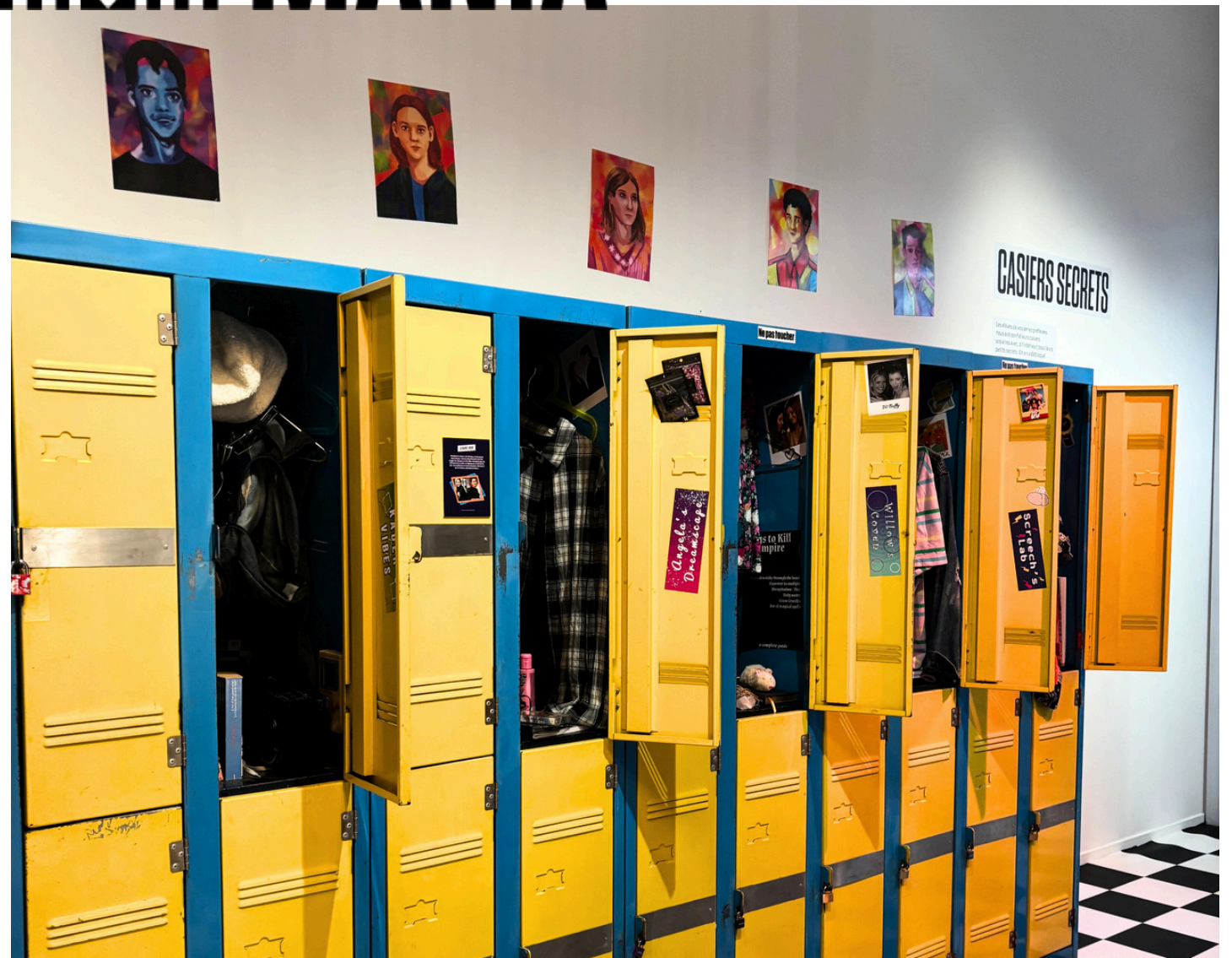
Réalisée dans le cadre des ateliers éducatifs avec EIC Tourcoing, le BTS comm' Saint Luc de Cambrai, le lycée Le Castel de Dijon, et les participants et participantes volontaires.

Vous préférez les séries actuelles ou celles des années 90 ?